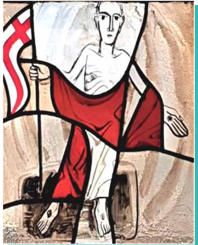
Der Auferstandene. Glasfenster von Wolf-Dieter Kohler. Michaelskapelle – Friedrichsthal/Schwarzwald.

Was wäre das für ein Osterfest, wenn wir tatsächlich in den Menschen neben uns, in den Menschen, die uns immer wieder neu begegnen, wirklich denjenigen leibhaft und konkret erwarten und sehen würden, den wir Jesus nennen,